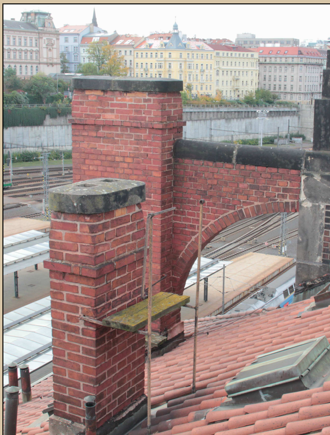
pohled komínovou hlavici